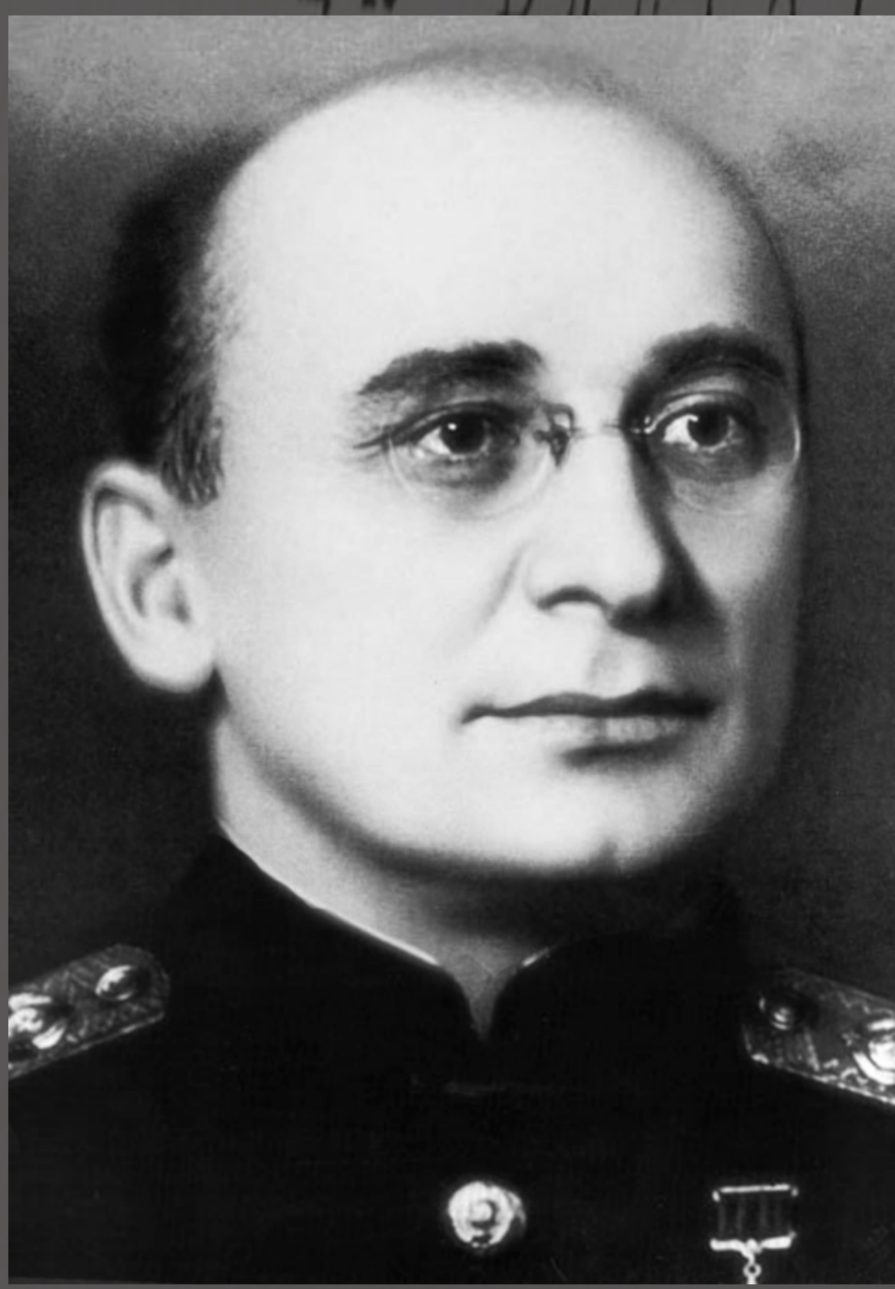
Ludowy Komisarz Spraw Wewnętrznych Związku Sowieckiego Ławrientij Beria