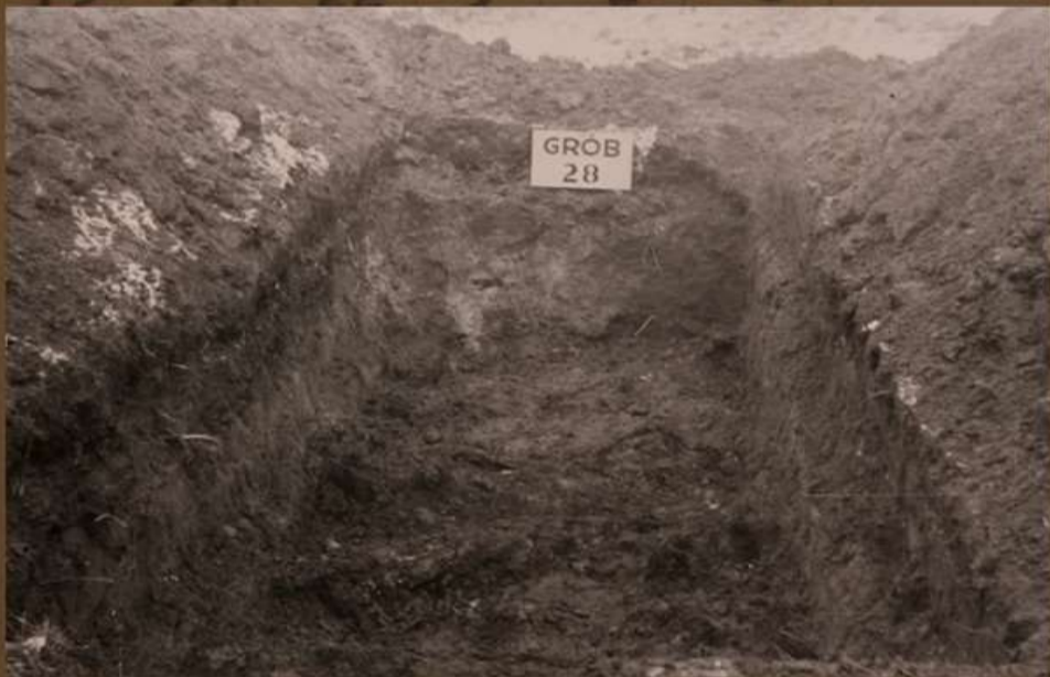
Grób myśleniczian nr 28.

Fragmenty protokołu Głównej Komisji Badania Zbrodni Niemieckich w Polsce