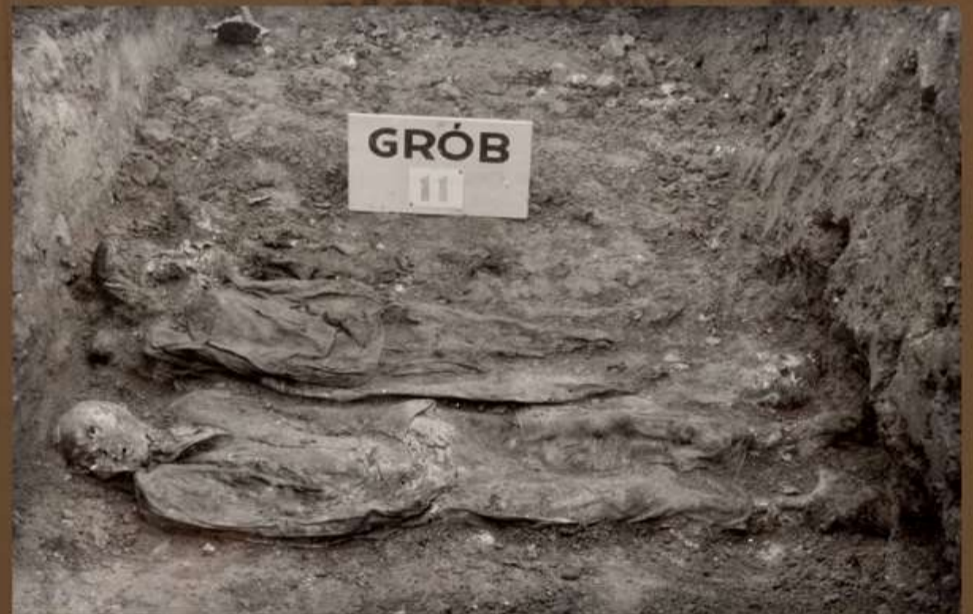
Grób myśleniczian nr 11.

Podczas ekshumacji zwłok z grobu nr 28 dwadzieścia zidentyfikowano jako ofiary z Myślenic: