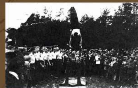
Kazimierz Skóra podczas występów akrobatycznych na Zarbiu