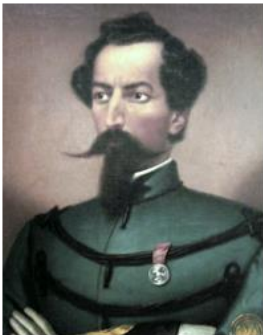
Francesco Nullo