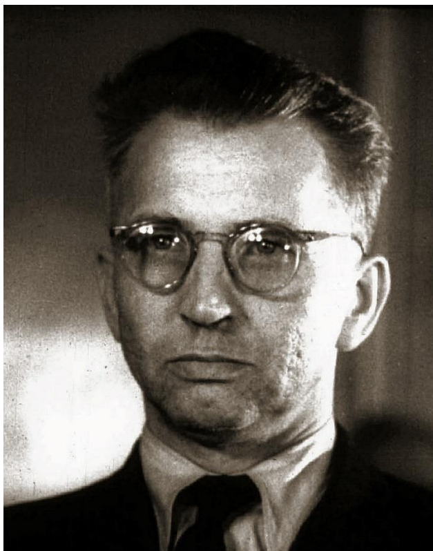
Leopold Okulicki na „Procesie szesnastu” w Moskwie w 1945 roku

22 stycznia 1945 roku żołnierze Armii Czerwonej wkroczyli do Myślenic. W miesiącu w którym czerwonoarmiści zajęli położone nad Rabą miasto, zakończyła swoją działalność Armia Krajowa (AK). Ta największa organizacja konspiracyjna w kraju została rozwiązana 19 stycznia 1945 roku przez ostatniego komendanta AK gen. Leopolda Okulickiego.